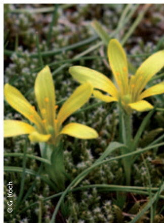
Gagée de Bohême