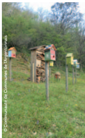
Nichoirs et maison à insectes

Afin de préserver la richesse de son patrimoine environnemental, le Clos de l'oncle Georges a été désigné Espace Naturel Sensible. À ce titre, il bénéficie de la politique de préservation et d'éducation à l'environnement du Conseil général des Deux-Sèvres.