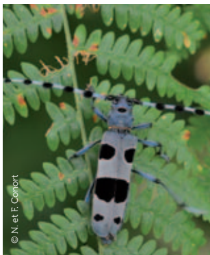
Rosalie des Alpes